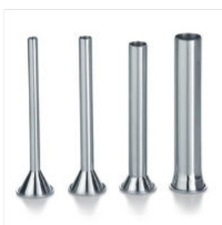
N/p kimštuvai ø 13-16-20-38 pasirinktiniai