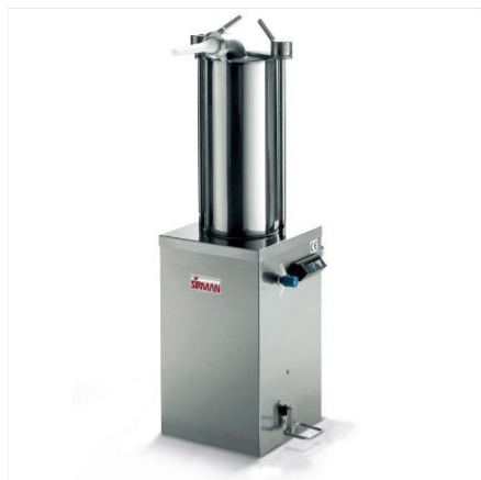
Sirman dešrų kimštuvas, modelis IS 15 Idra :

Paprasti ir funkcionalūs, naujieji IDRA vertikalūs hidrauliniai dešrų kimštuvai turi galingą sistemą veikiančią 120 bars spaudimu. Pilnai pagaminti iš nerūdijančio plieno, kimštuvai yra greitai išrenkami valymui nepreikiant jokių įrankių.