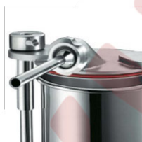
Pasirinktinai n/p tvirtinimas