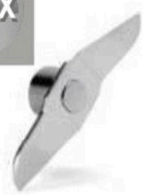
Lengvai išrenkami nerūdijančio plieno peiliukai