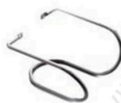
FSPM Prie sienos tvirtinamas laikiklis